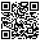
F110 3D demo